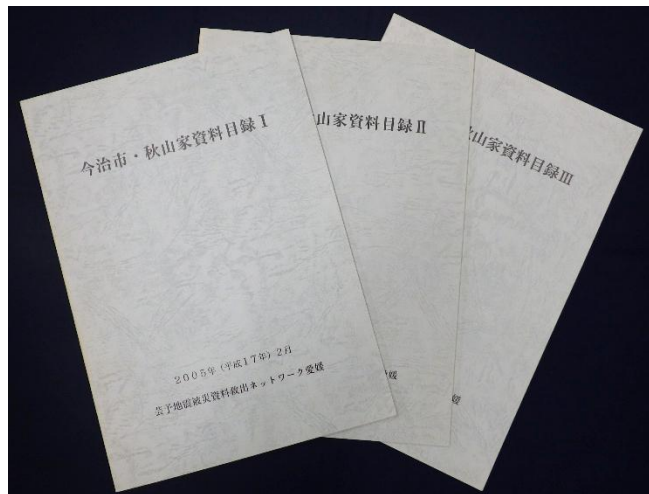
芸予地震被災資料救出ネットワーク愛媛編 『今治市・秋山家資料目録Ⅰ～Ⅲ』(2005～2007年)

四半世紀は決して短い時間ではありませんが、自分の遅々たる歩みには愕然とするばかりです。それでも愛媛資料ネットで得た学びは、少しずつ熟成しているようです。史料ネットの活動も歴史研究も息の長い取り組みです。学びが実を結ぶように努力を続けるとともに、次の世代に繋いでいくことを大切にしたいと思います。