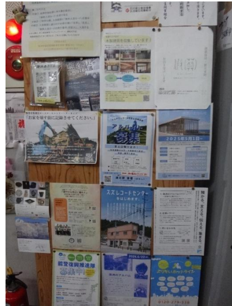
「海浜あみだ湯」の掲示板（珠洲市）

市民やボランティアでにぎわう銭湯「海浜あみだ湯」に行くと、復興に関わるチラシがたくさん貼ってあった。最後に、歴史資料関連のチラシを紹介して、奥能登の過去と未来に思いをはせながら擱筆する。