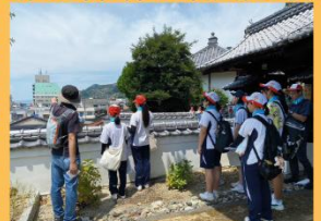
2024年8月 八幡浜市社協主催のまち歩き