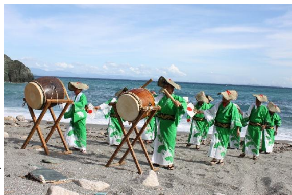
伊方町大久地区のしゃんしゃん踊り▶ (2010年撮影)