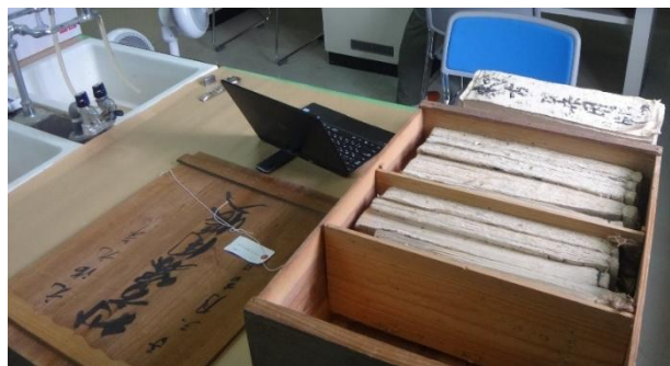
竹端家文書の一部

一、今般手上高被仰渡候ニ付、配分之義者御高過分之事ニ付、山役銀之ケ所山畑等迄ニ茂見込を以割合被成候処、私共濱居屋敷者指省配分無之由承リ候ニ付、私共不得心ニ候間、村御役人中長百姓中等へ御談申候義ハ、右手上高之内濱屋舗ニ茂割合有之候様ニ与申候得者、左候而ハ於後々ニ年濱屋敷地面之内ニ而御塩濱ニ致度旨望申人有之候共、不指支様之示談ニ付、其地面御高附ニ致置候共、御塩濱ニ望人有之節ハ代リ屋舗御渡被成建物類之