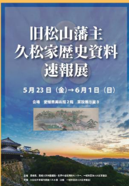
旧松山藩主久松家歴史資料速報展 広報用チラシ